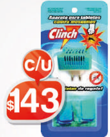
APARATO CLINCH + 8 TABLETAS