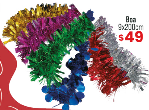
Boa 9x200cm $49