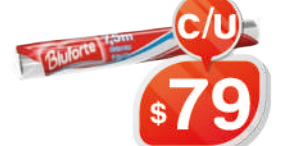
PAPEL ALUMINIO BLOFORTE 45CM X 7,5 MTS