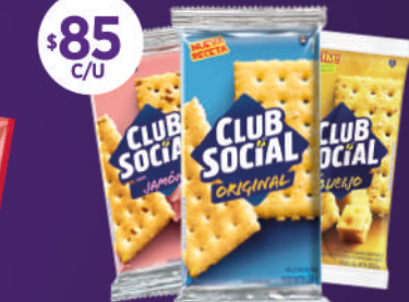
Club Social Todos los sabores