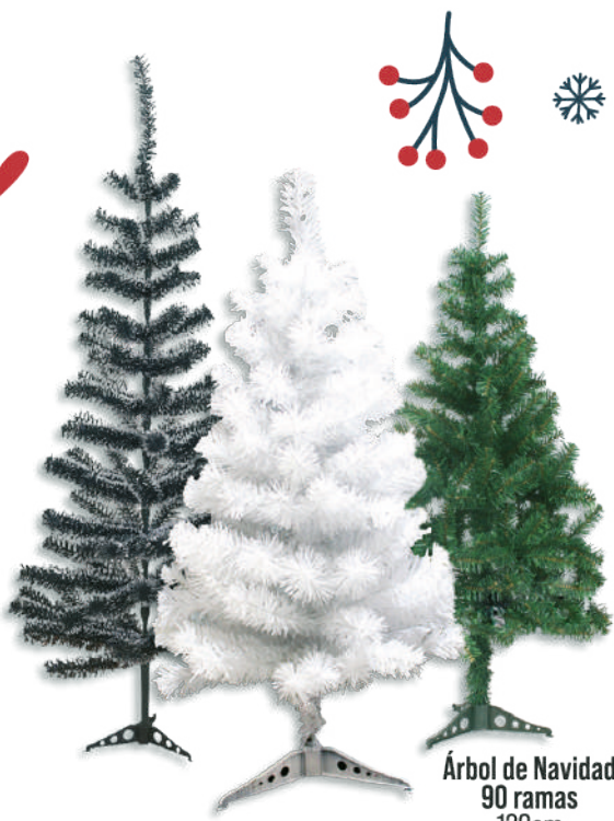
Árbol de Navidad 90 ramas 120cm $239