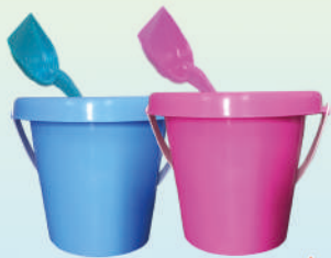
Balde Liso con Pala