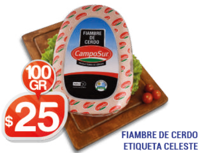
FIAMBRE DE CERDO ETIQUETA CELESTE