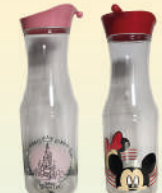
Botella Sottile 1200 ml