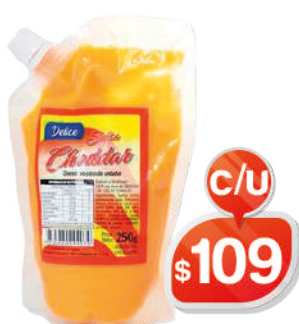
SALSA DELICE CHEDDAR 250GR