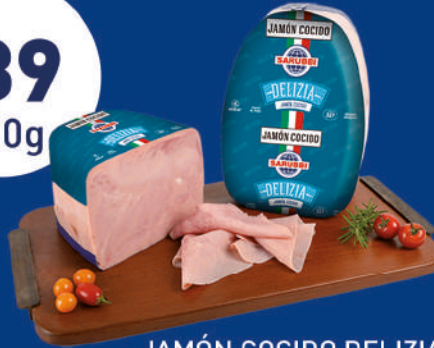
JAMÓN COCIDO DELIZIA