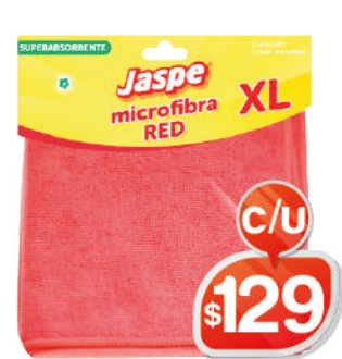
PAÑO MICROFIBRA ROJO XL JASPE