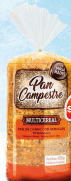
PAN CAMPESTRE MULTICEREAL