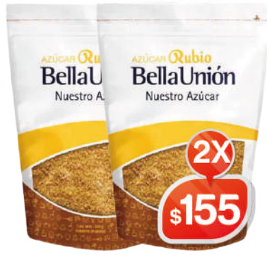
AZÚCAR RUBIO DE CAÑA DOYPACK 500G