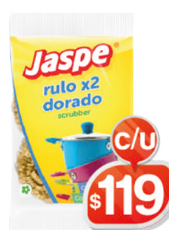
RULO DE BRONCE X2 JASPE