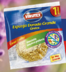
Esponja Orotex Dorada