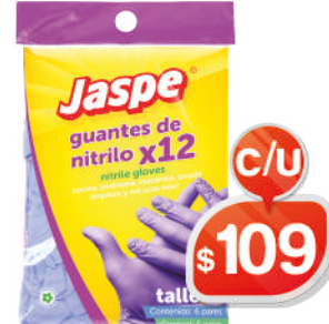
GUANTES DE NITRILLO X12 JASPE