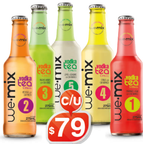
VODKA TÉA HELADO 275ML