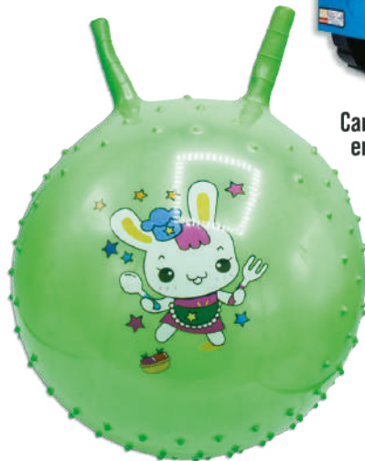
Pelota saltarina inflable 4 colores 300g - 45cm $249