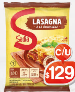
LASAÑA BOLOGNESE SADIA 350G