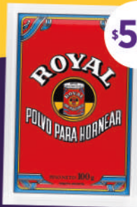
Polvo Royal 100 grs