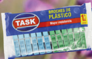
12 Palillos para ropa plásticos