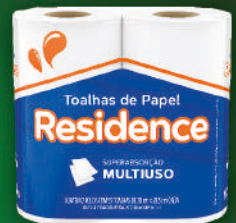
Toalla de cocina Residence 2x55 - hojas dobles