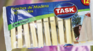
12 Palillos para ropa de madera