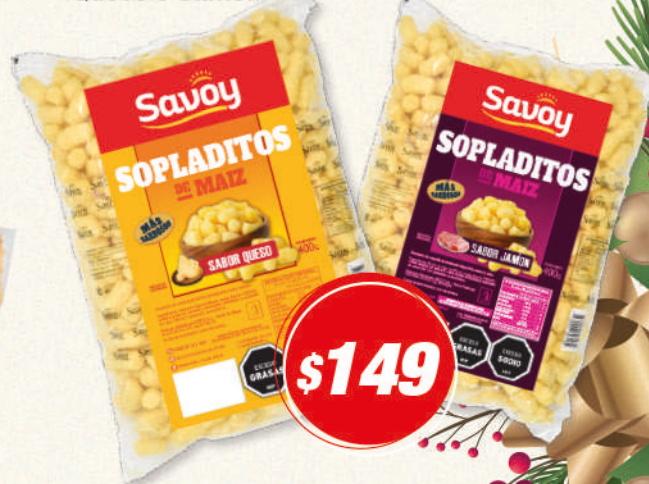
Sopladito RISTORANTE 400G -Queso o Jamón-