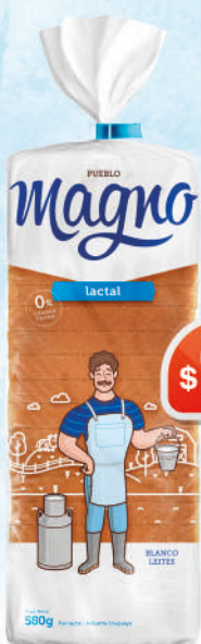
MAGNO LACTAL GRANDE