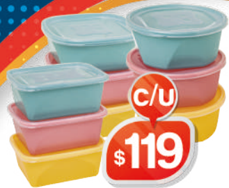
KIT 3 PIEZAS CUADRADO 1.2ML