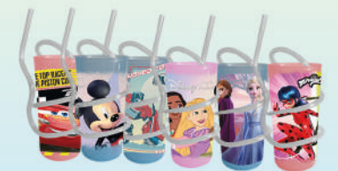
Vaso Recto Arco Iris Varios Personajes