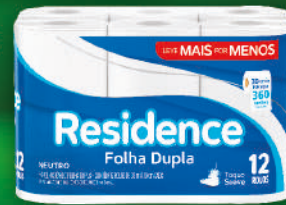
Residence Folha Dupla