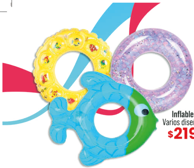
Inflable Varios diseños $219