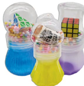
Slime en pote Colores surtidos $99