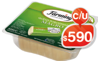
MAGRO FRACCIÓN AGRICULTURA