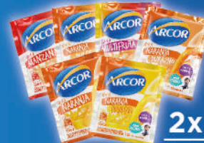
2x $25 Jugos Arcor Naranja - Naranja/Banana Naranja/Durazno - Naranja Dulce Manzana - Multifruta