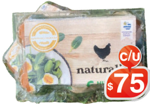
HUEVOS NATURALITO X6