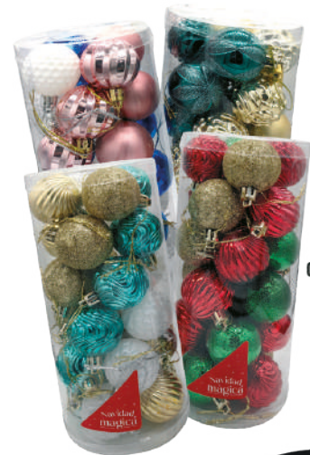
Esferas N° 4 combinadas x24 9.5x21cm $299