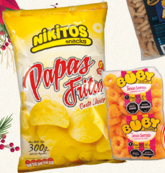
Papa Clasica 300G + BUBY jamon 50G