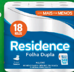
Residence Folha Dupla