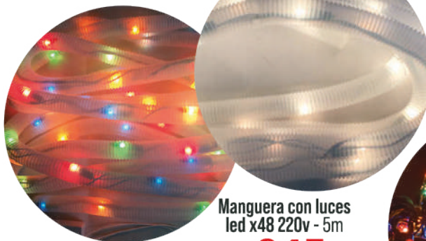
Manguera con luces led x48 220v - 5m $345