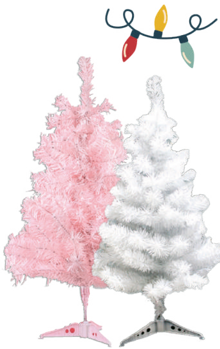
Árbol de Navidad 50 ramas 60cm $109