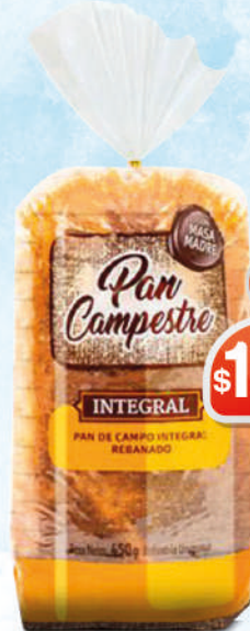
PAN CAMPESTRE INTEGRAL