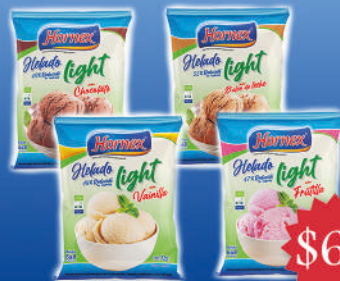
Helado light 72g Hornex sabor: Chocolate, frutilla, dulce de leche y vainilla.