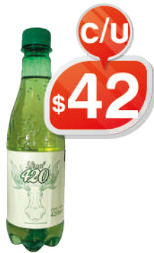
LIMOL 420 - 420ML