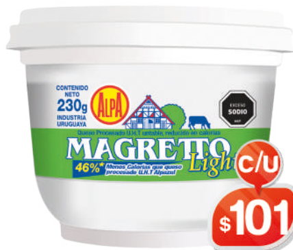
MAGRETTO POTE 230GRS