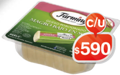
MAGRO BAJO SODIO FRACCIÓN AGRICULTURA