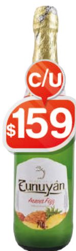
ANANA 710ML TUNUYAN