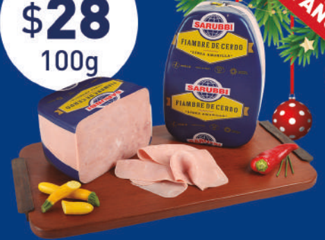
FIAMBRE CERDO LÍNEA AMARILLA