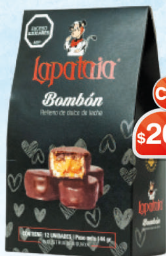
BOMBONERA RELLONO DDL X12 UN