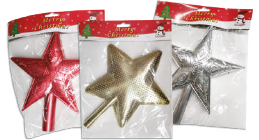
Puntero estrella 12.5x26cm $99