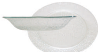
PLATO GOURMET llano / hondo flint