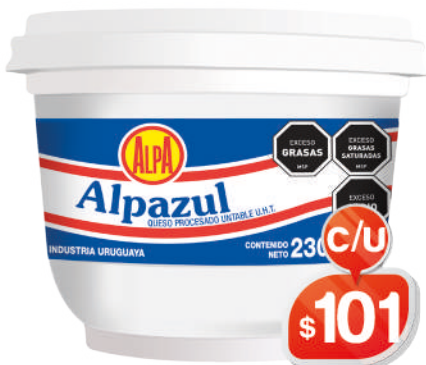
ALPAZUL SUPERUNTABLE POTE 230GRS