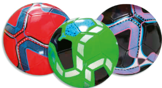
Pelota de fútbol de eco cuero Nº5 - Varios colores $359