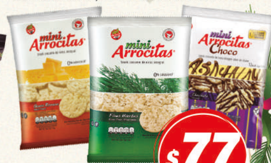
Mini ARROCITAS 53G Queso romano, Finas hierbas o Chocolate