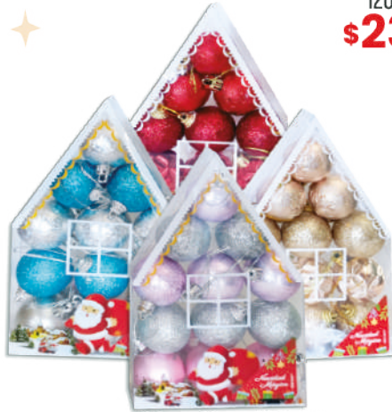
Esferas Home N° 4 x12 12x20x4cm $169