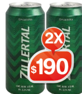
ZILLERTAL LAGER LATA - 473ML