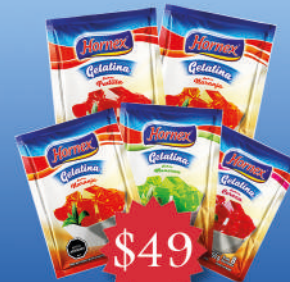
Gelatina Hornex regular 50g