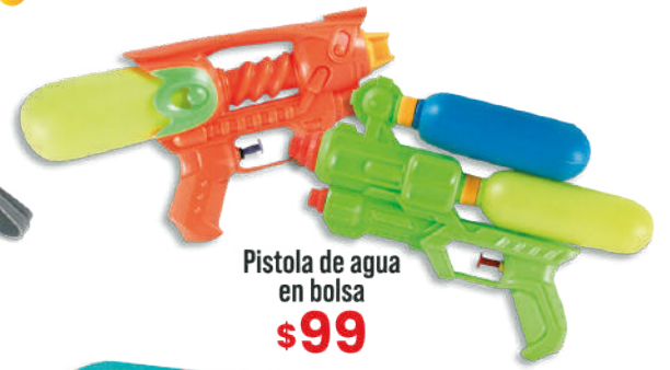
Pistola de agua en bolsa $99