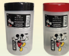
Frasco Organizador Toda Hora 1100 ml