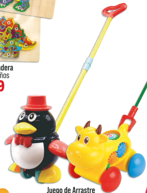
Juego de Arrastre $349