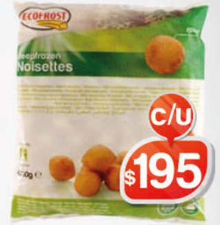
PAPAS NOISETTE ECOFROST 1KG