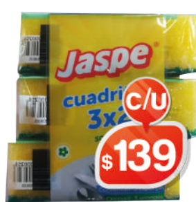
FIBRA ESPONJA CUADRITO 3X2 JASPE