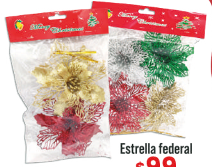
Estrella federal $99