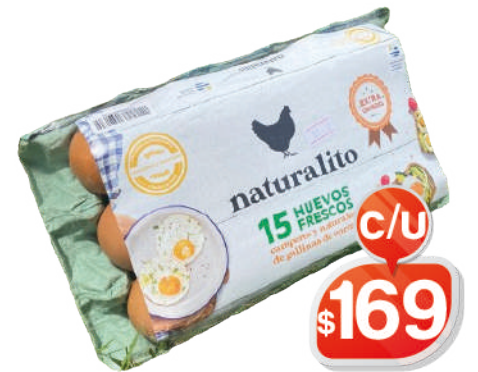
HUEVOS NATURALITO X15