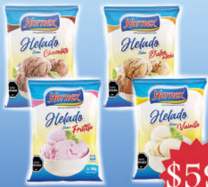
Helado Hornex 100g sabor: Chocolate, frutilla, dulce de leche y vainilla.