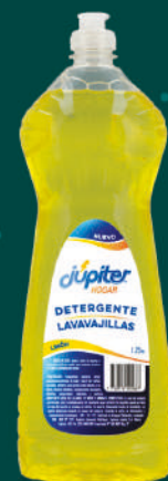
Detergente 1.250 mL