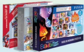
Juego de Memoria con lentes 3D Varios Personajes