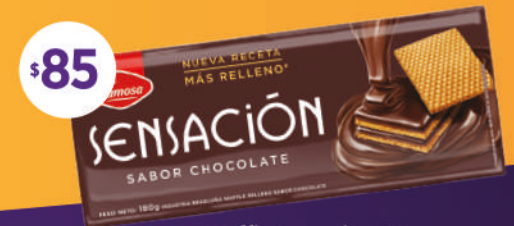
Waffle Sensación 180 grs