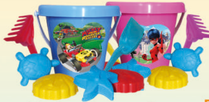
Balde Licencia con Pala Rastrillo y 4 moldes Personajes: Mickey, Minnie Princesas, Cars, Transformers, My Little Pony y muchos más!