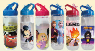
Botella Excursión 600 ml Varios Personajes