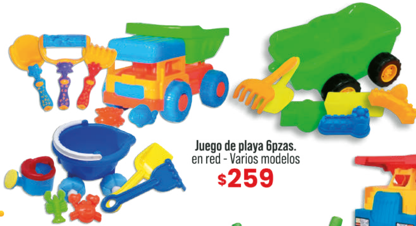
Juego de playa 6pzas. en red - Varios modelos $259