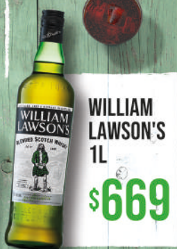
WILLIAM LAWSON'S 1L $669