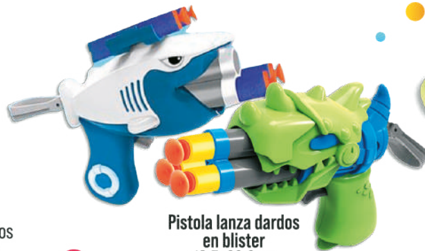
Pistola lanza dardos en blister 16.5x20.6cm $179