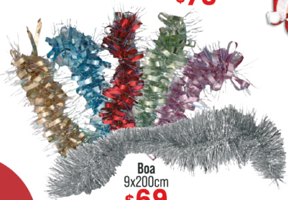
Boa 9x200cm $69