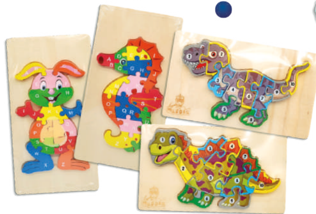
Puzzle de madera Varios diseños $169