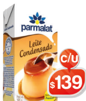
PARMALAT LECHE UAP CONDENSADA 395GR