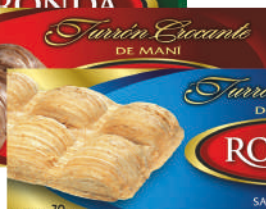
TURRÓN RONDA CROCANTE ALMENDRA - CHOCOLATE - COCO