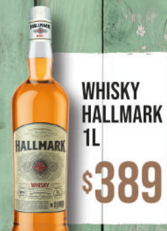
WHISKY HALLMARK 1L $389