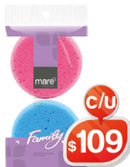
FAMILIA DE YEGUAS X2 JASPE