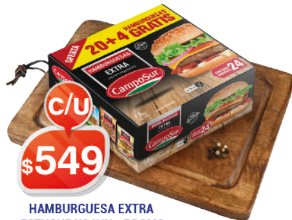
HAMBURGUESA EXTRA ESTUCHE X24UN - PROMO