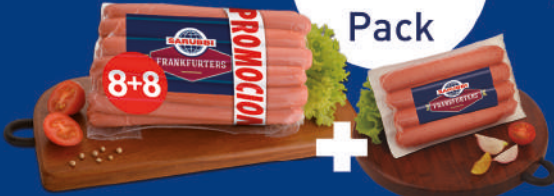
FRANKFURTERS SARUBBI 8 + 8 (+ 4 DE REGALO)