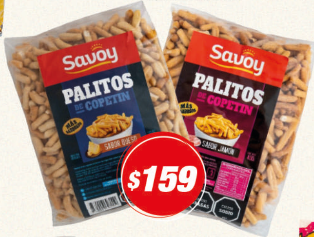
Palitos RISTORANTE 400G -Queso o Jamón-