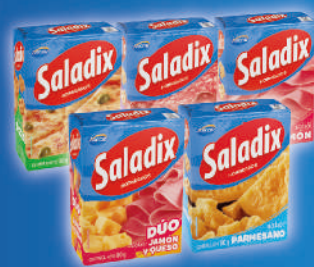
$65 c/u Saladix 80/100g Jamón - Pizza - Dúo Calabresa - Parmesano