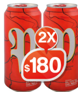
PATRICIA LATA 473ML - LAGER