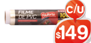
FILME PVC BLUFORTE 28CM X 100MTS