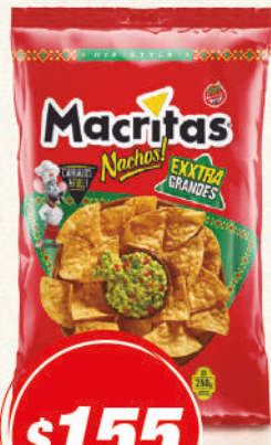
Nacho MACRITAS Clasico 250G