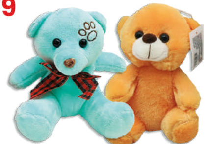
Oso de peluche Varios colores y diseños $189