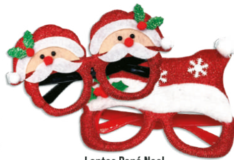
Lentes Papá Noel $79