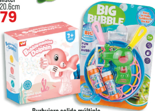
Burbujero salida múltiple Varios modelos $299