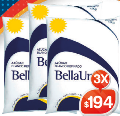
AZÚCAR BLANCO REFINADO BELLA UNIÓN 1KG