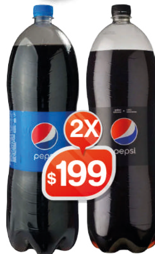
PEPSI - PEPSI BLACK - 2LT