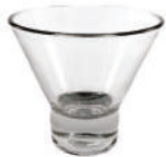
COPA POSTRE ATENAS 210 ml