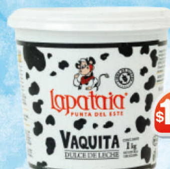
DULCE DE LECHE LA VAQUITA 1KG