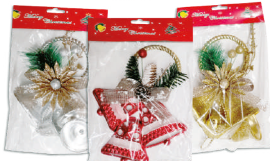
Colgante campanas $119