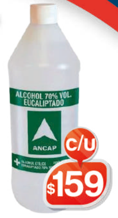
ALCOHOL EUCALIPTADO ANCAP 70° 950 ML