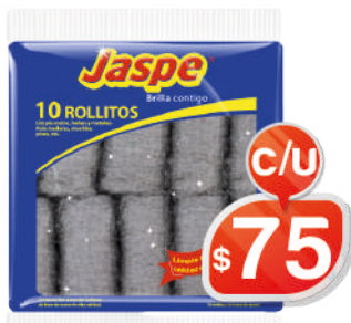
ROLLITO ALUMINIO X10 + ESPONJA JASPE