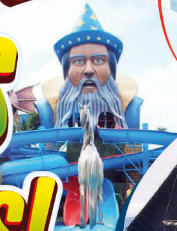
PARQUE DE AGUA