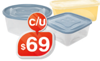
POTES DE 3LTS. REDONDO - CUADRADO - RECTANGULAR