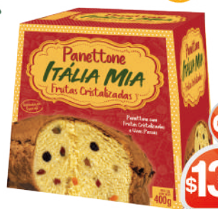
PANETTONE ITALIA MIA - 400G. C/GOTAS DE CHOCOLATE - FRUTAS