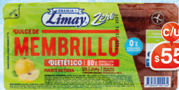
DULCE DE MEMBRILLO DIET 250G