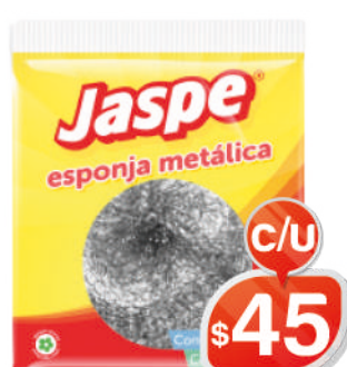
ESPONJA METÁLICA JASPE