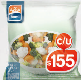
ENSALADA DE BROCOLI HOMI 1KG