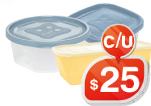
POTES: REDONDO 740ML - CUADRADO 690ML - RECTANGULAR 750ML