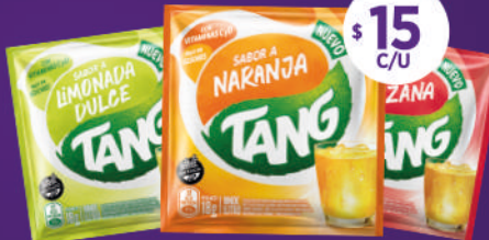
Sobre Tang Todos los sabores