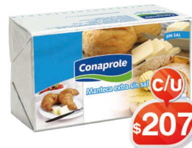
MANTECA C/ SIN SAL 500 GRS