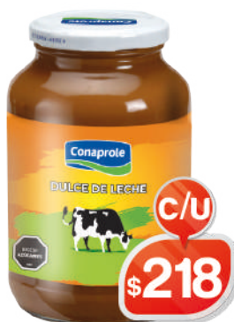
DULCE DE LECHE FRASCO DE VIDRIO CLÁSICO 970GRS