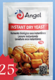
Levadura Angel 10g