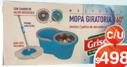
MOPA GIRATORIA 360°