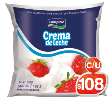
CREMA DE LECHE - SACHET 500 ML