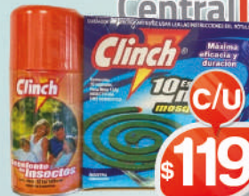
PACK REPELENTE CLINCH + ESPIRAL