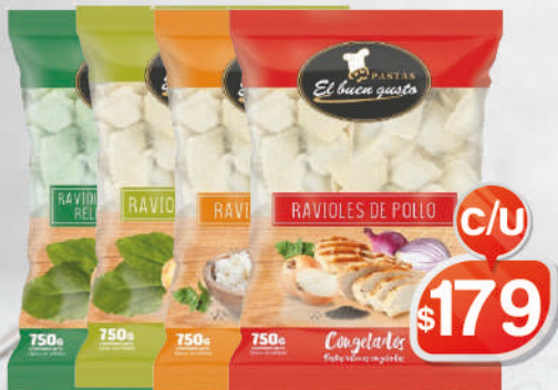
RAVI VERDURA EL BUEN GUSTO / RICOTA EL BUEN GUSTO POLLO EL BUEN GUSTO / ESPINACA EL BUEN GUSTO JAMÓN & VERDURA EL BUEN GUSTO