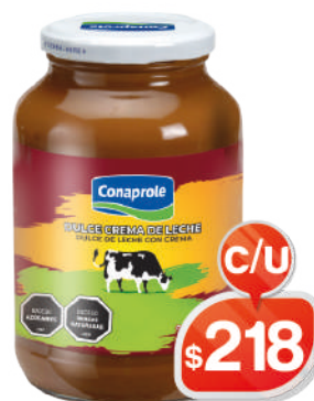
DULCE CREMA DE LECHE 925GRS