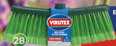
Escoba Multiuso Extra Grande (completa!)