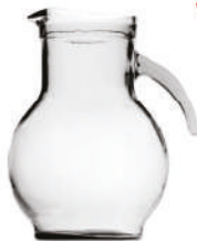
JARRA VALLARTA flint 1,5 L