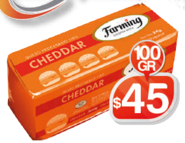
CHEDDAR BARRA AGRÍCOLA 100GRS