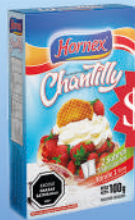
$82 Chantilly Hornex regular 100g