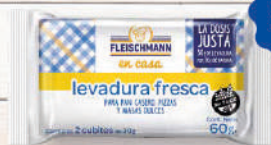
Levadura Fresca 60g