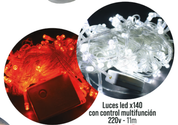
Luces led x140 con control multifunción 220v - 11m $279