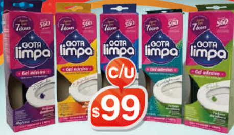
GEL SANITARIO GOTALIMPA 7 CITRONELA