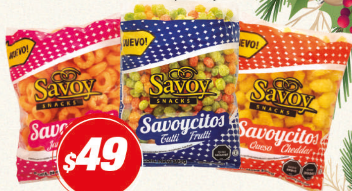
SAVOYCITOS 100G -queso, jamón o Tutti frutti-