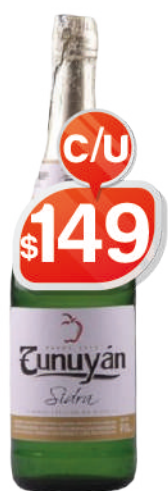
SIDRA 910ML TUNUYAN