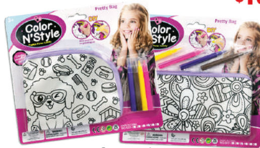
Set para pintar en blister 23.5x21.5x1cm $159