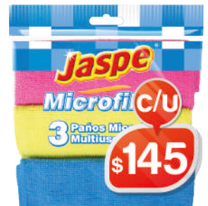
PAÑO MICROFIBRA X3 JASPE