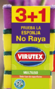
Esponja Clásica x 3 + Esponja No Raya