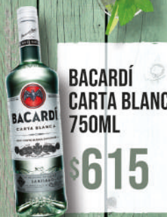
BACARDÍ CARTA BLANCA 750ML $615