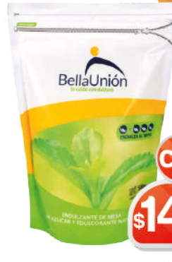
ENDULZANTE BELLA UNIÓN DOYPACK 500G