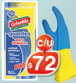
GUANTES GRISELDA BICOLOR - S, M, L, XL