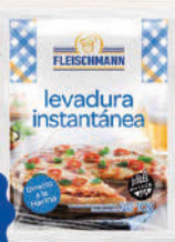
Levadura Seca Instantánea 10g