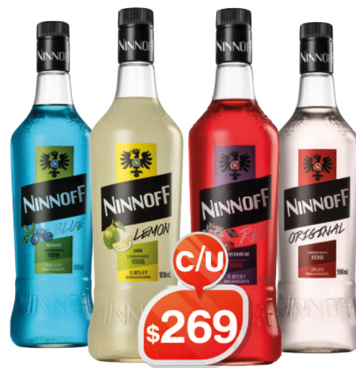
VODKA NINNOFF 900ML