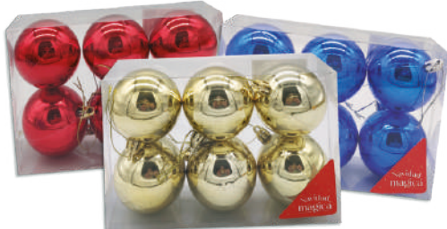
Esferas N° 6 brillosas x6 18x12x6cm $75