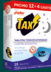
Tabletas TAX 16 unid