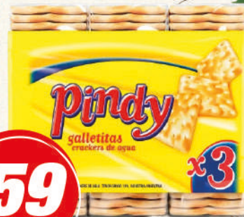
ARGENTITAS Cracker 306G