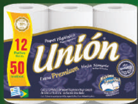
Papel Higiénico Unión 12 x 50 mts