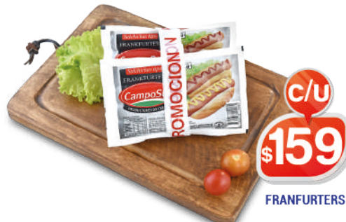
FRANKFURTERS CORTES 2X8 PROMO