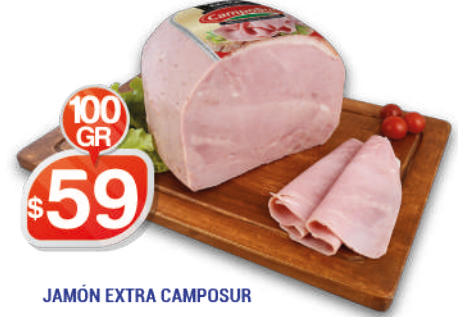
JAMÓN EXTRA CAMPOSUR