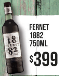
FERNET 1882 750ML $399