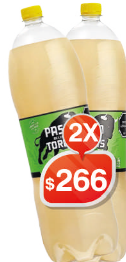
POMELO 2,5LT PASO DE LOS TOROS