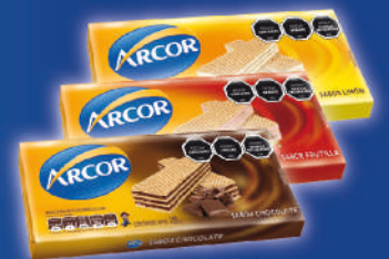
2x $60 Waffles Arcor 105g Chocolate - Limón