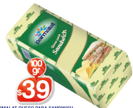
PARMALAT QUESO PARA SANDWICH