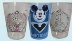
Vaso Cónico 350 ml