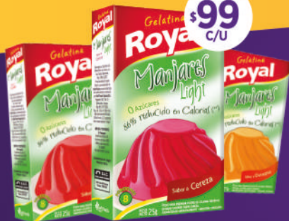
Gelatinas Royal Light