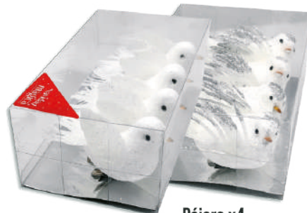
Pájaro x4 $179