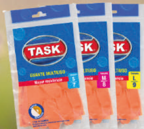
Guantes Task Multiuso talles S/M/L