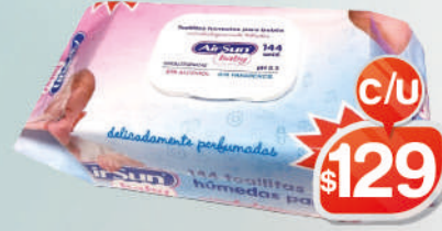
TOALLITA BABY X 144 UNIDADES