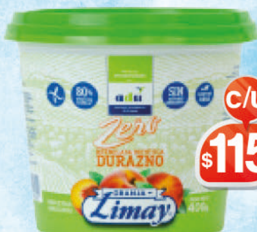
MERMELADA DE DURAZNO ZERO 400G