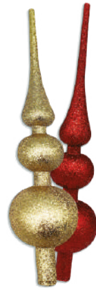
Puntero con glitter 30cm $49