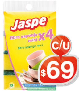
FIBRA ESPONJA MINI X4 JASPE