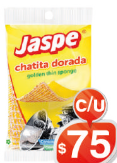
CHATITA DORADA JASPE