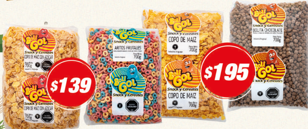
Copos con azúcar o Copos de maiz, o Aritos frutales, o Bolitas chocolate BOLIGOL 700G + Galleta DALE rellena 81G