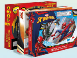
Puzzles con lentes 3D Varios Personajes