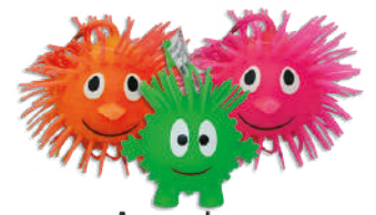
Amansa loco Varios colores $49