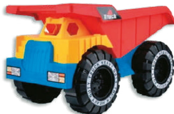
Camión volcador Truck Powerful en bolsa de PVC - 25x32x15cm $329