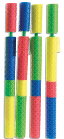
Pistola de agua espuma 30x20x40cm $189