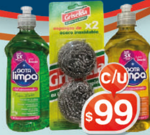
PACK CONCENTRADO 500 2 UNIDADES + ESPONJA