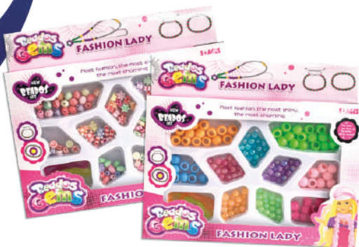
Juego para armar accesorios 19x16x2.5cm $139