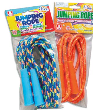
Cuerda para saltar en bolsa de PVC Varios colores y diseños 11x26x2cm $79