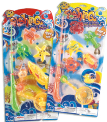
Juego de pesca en blister $199