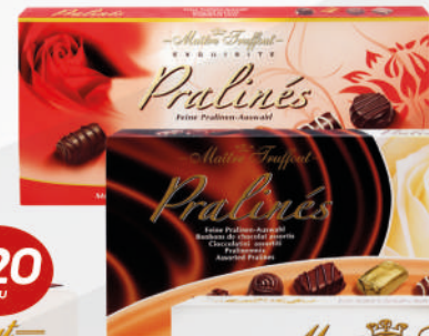
Bombonera 180 grs