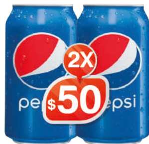
PEPSI LATA 354ML