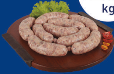
CHORIZO PARRILLERO SARUBBI X 12