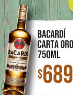
BACARDÍ CARTA ORO 750ML $689