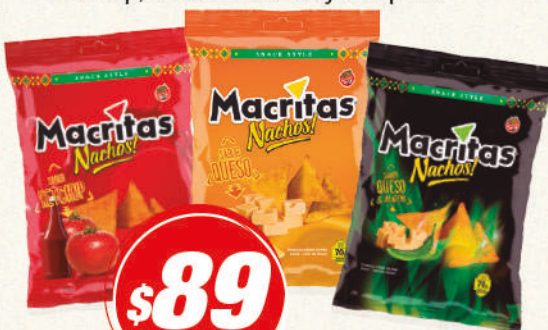
Nacho MACRITAS 70G Ketchup, Queso o Queso y Jalapeño