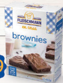
Premezcla Brownie 450g