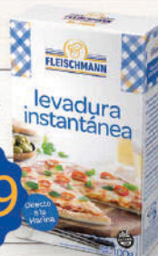
Levadura Seca Instantánea 100g