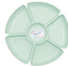
COPETINERO 6 bocas Ø 32,5 cm plástico pastel