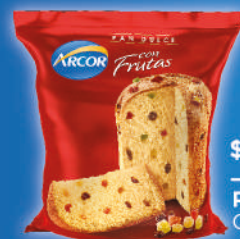
$239 Pan Dulce Arcor 500g Con frutas