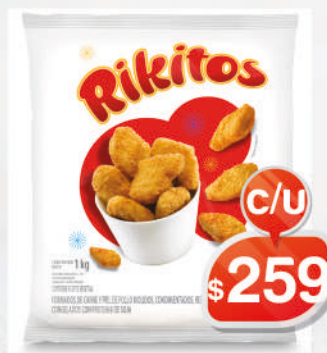
RIKITOS X 1KG