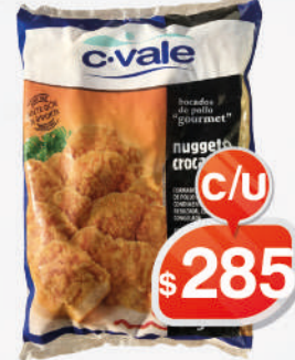
NUGGET CROCANTES C-VALE 1KG