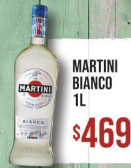
MARTINI BIANCO 1L $469