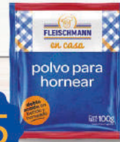
Polvo de Hornear 100g