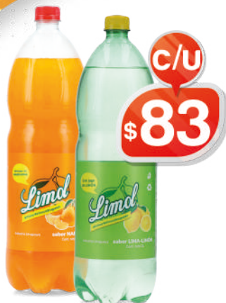
LIMOL NARANJA/LIMÓN 2LT