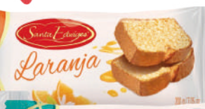
BUDIN MARMOLADO - CHOCOLATE - GOTAS DE CHOCOLATE - NARANJA 200G