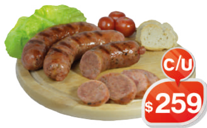
CHORIZO PARRILLERO PATA O RUEDA EN GANCHO