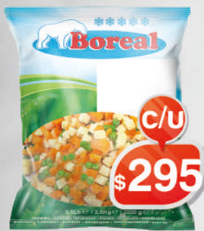
ENSALADA RUSA BOREAL 2,5KG