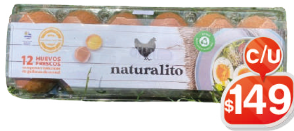
HUEVOS NATURALITO X12