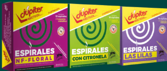
Espiral Júpiter Floral, Citronella y Lavanda 10 unid + soporte metálico