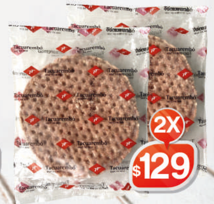
PACK HAMBURGUESAS FRIG. TACUEREMBO 2X 84G