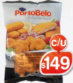
FORMITAS MERLUZA PORTOBELLO 500G