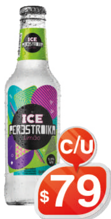
VODKA ICE PERESTROIKA LIMÓN 275ML