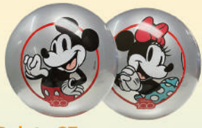
Pelota 23 cm Disney 100 Años